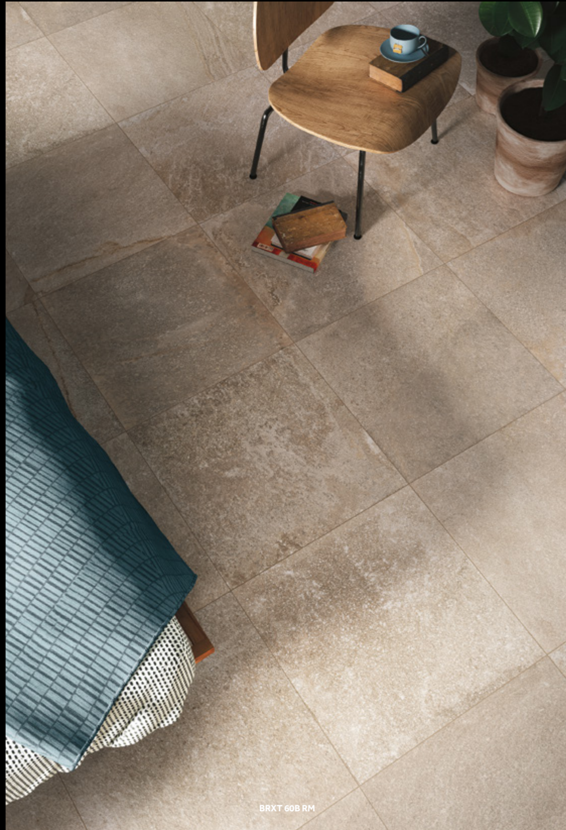
BRXT 60B RM